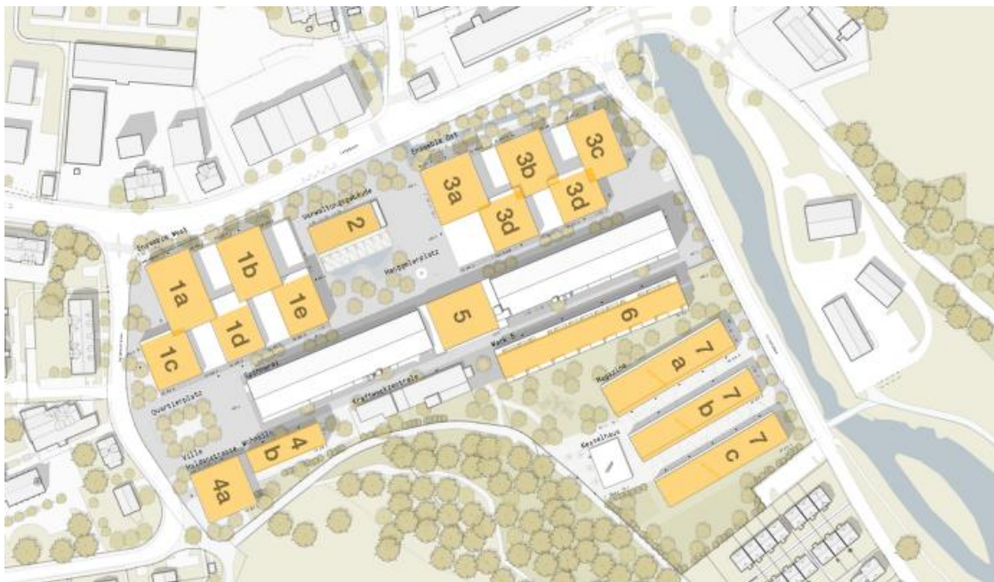
Abbildung 1: Dächer mit abgeschätztem PV-Potential

Es ist geplant, den erzeugten Strom im Rahmen eines Zusammenschlusses zum Eigenverbrauch (ZEV) zu nutzen.