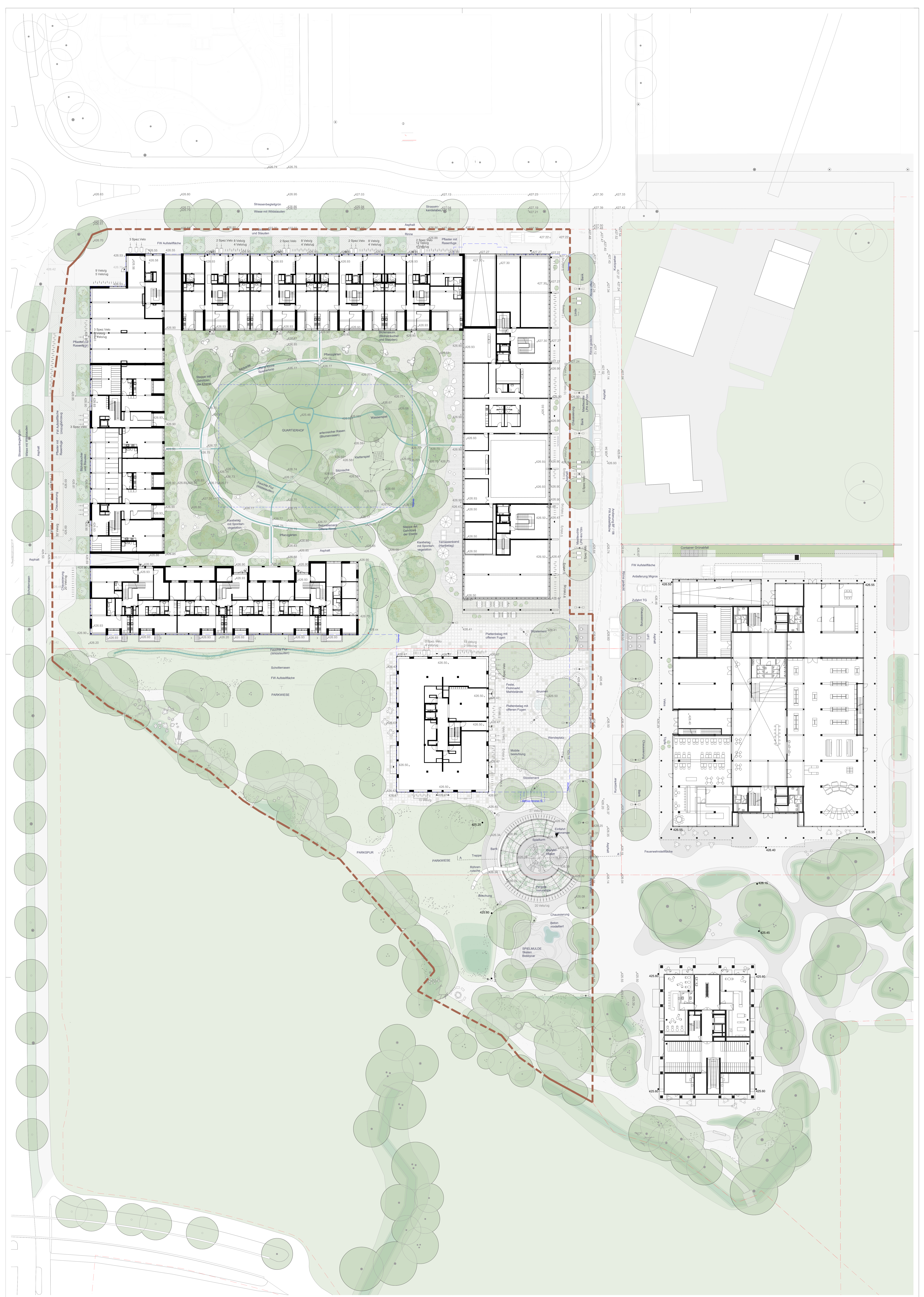
STIMMUNGSBILDER - Wohnhof